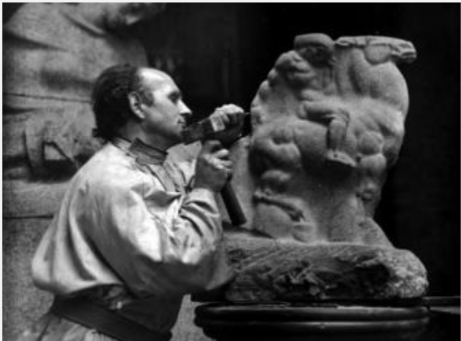
Jac. Maris aan het werk.